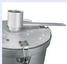
フラットリッド式 (平面仕上)