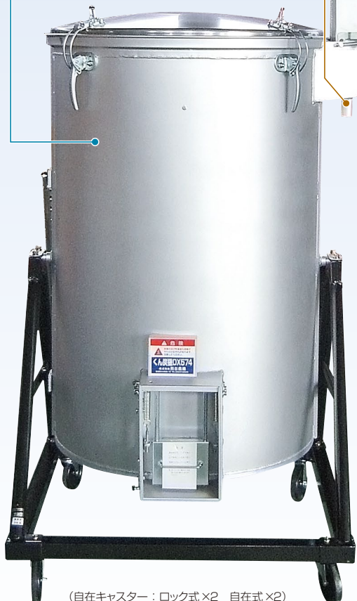
(自在キャスター：ロック式×2 自在式×2)